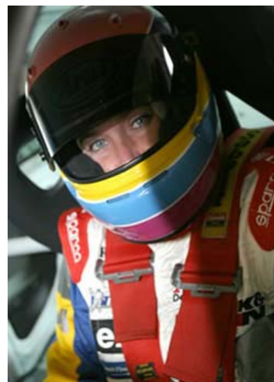
BACK IN TIME

Na bijna twee uur racen lag Mani Racing aan de leiding, met op drie ronden GVD Racing Team en CAB-Flexo Racing Team, beiden kregen te kampen met problemen aan de kart en verloren zo'n vijf minuten. Daardoor behaalde Mani Racing uiteindelijk vrij eenvoudig de overwinning, met op twee ronden GVD Racing Team. DW Racing werd nog derde, voor CAB-Flexo.